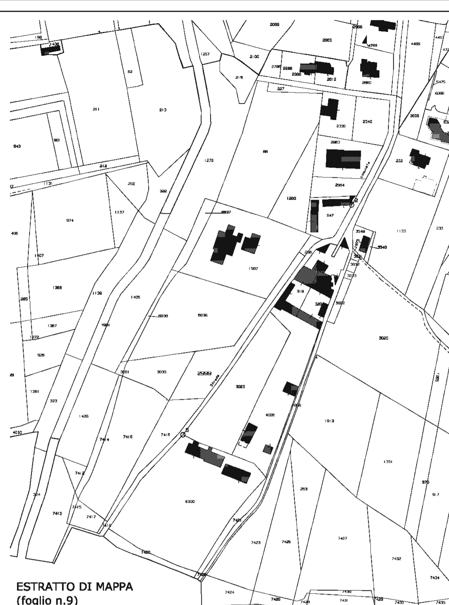
ESTRATTO DI MAPPA (foglio n.9) (1:2.000)