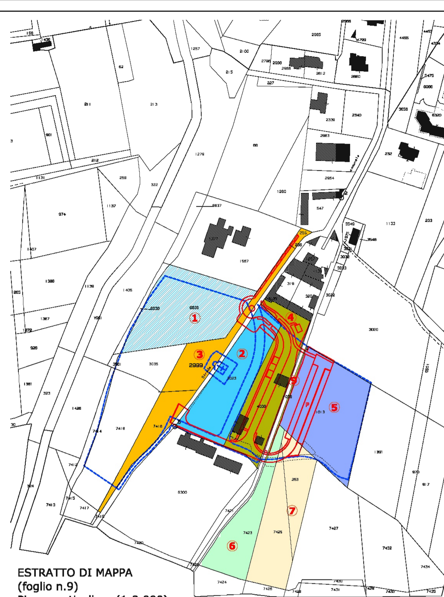
ESTRATTO DI MAPPA (foglio n.9) Piano particellare (1:2.000)