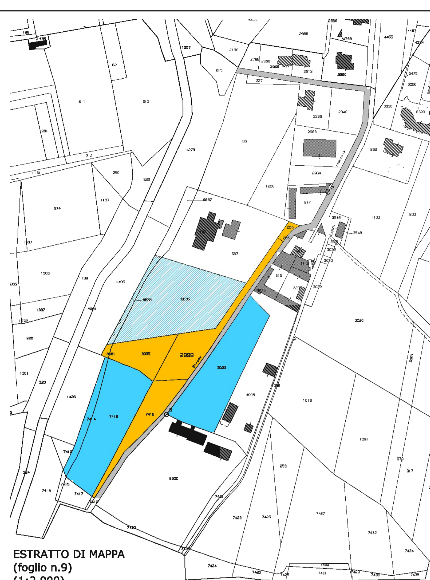
ESTRATTO DI MAPPA (foglio n.9) (1:2.000)