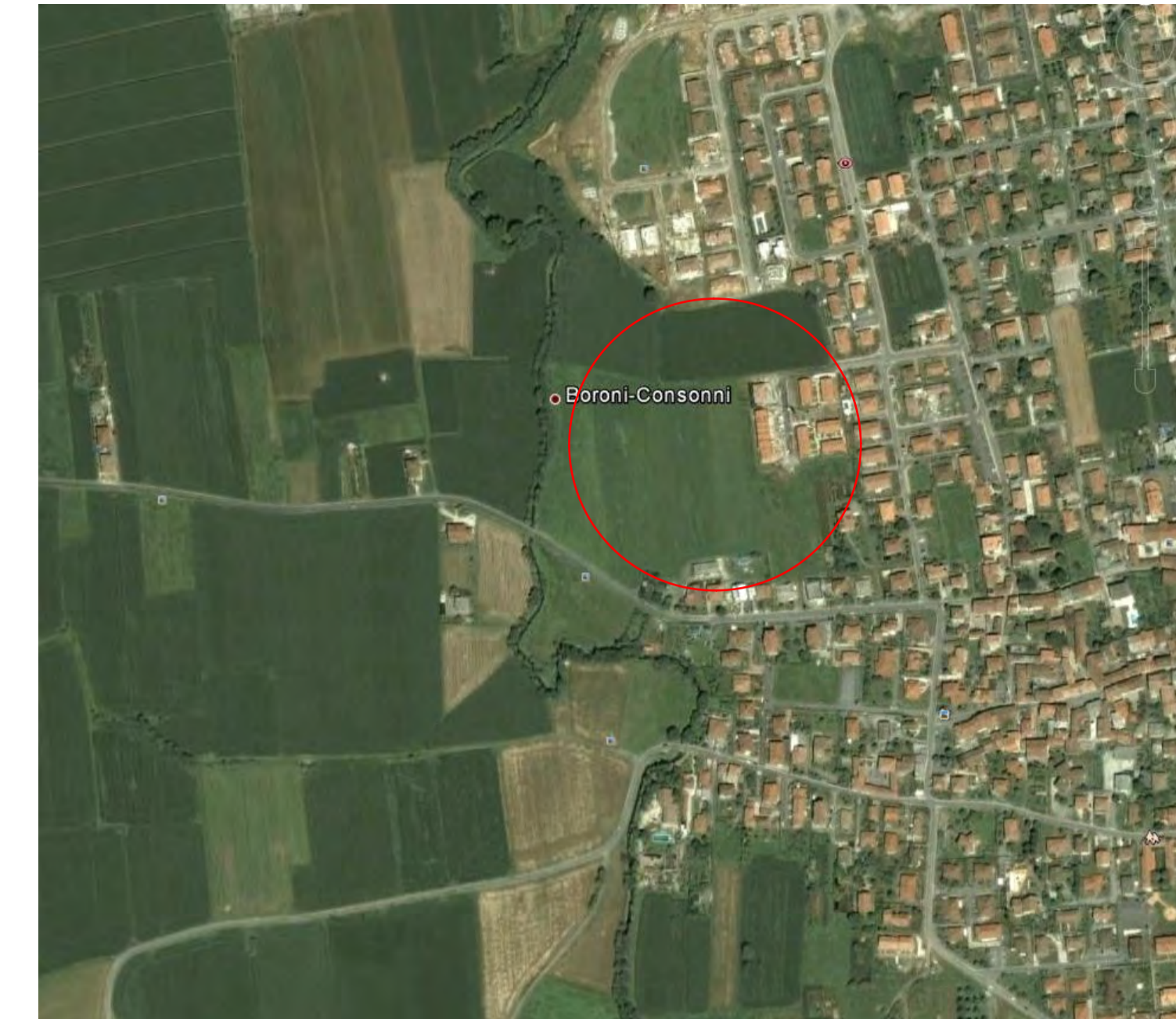
IMMAGINE DEL TERRITORIO

COMUNE DI BONATE SOPRA - Provincia di BERGAMO