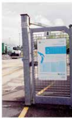
SESTO CALENDE e un'isola di depurazione ecologica

«Il nostro territorio è un bene prezioso, quindi, è nostro dovere mantenerlo in ottime condizioni. È compito del Comune di Bonate Sopra, in collaborazione con la Provincia, la Regione e gli altri Comuni, adottare strategie innovative per garantire un ambiente pulito e sostenibile. Tra le iniziative in corso, la figura dell'ispettore ambientale, per l'attività di controllo e monitoraggio del territorio, in collaborazione con la Provincia, la Regione e gli altri Comuni, è un passo importante per garantire un ambiente pulito e sostenibile. Tra le iniziative in corso, la figura dell'ispettore ambientale, per l'attività di controllo e monitoraggio del territorio, in collaborazione con la Provincia, la Regione e gli altri Comuni, è un passo importante per garantire un ambiente pulito e sostenibile.