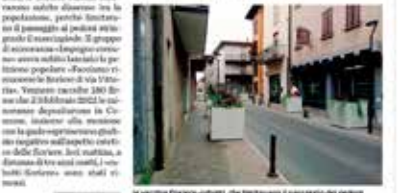
La nuova fioriera-cubotti, che bloccava il passaggio dei pedoni

A chiedere la rimozione erano state anche le firme di 280 cittadini. È una mozione