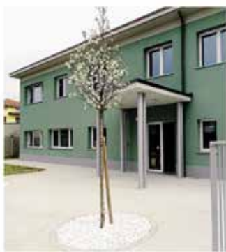
Il nuovo Centro diurno anziani a Bonate Sopra