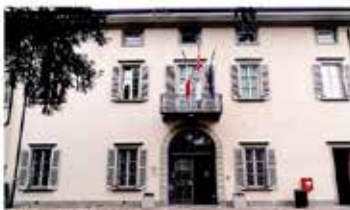
Attività per i giovani nel centro storico di Bonate Sopra

Il Comune di Bonate Sopra ha lanciato il progetto giovani "Il paese vuole ascoltare la loro voce". Il progetto prevede 11 iniziative per rendere protagonisti le nuove generazioni. Le iniziative sono: incontri con gli educatori nei luoghi di aggregazione, servizio civile per la comunità, corsi di formazione, laboratori creativi, spettacoli teatrali, concerti, mostre d'arte, iniziative sportive, iniziative culturali, iniziative sociali.