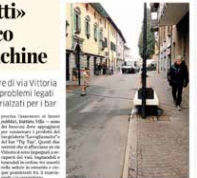
Le panchine previste nel centro a Bonate Sopra