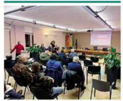
L'incontro tra Amministrazione e associazioni