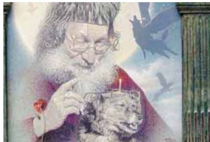
Treviolo, Santini Arte: «San Gipputo appare a Treviolo» di Geppo Monzio Compagnoni

inaugurazione della mostra di Geppo Monzio Compagnoni «San Gipputo appare a Treviolo».